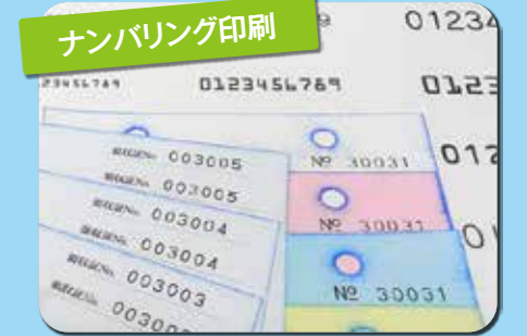
ナンバリング印刷

高い技術と豊富な経験と知識によって、印刷時に溶解・冷却の温度や印圧などを注意深く調整。平滑で転写・発色ムラのない、カーボン面を仕上げます。