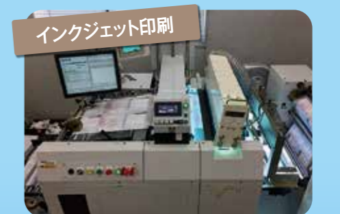
インクジェット印刷

商品券、住民票etc自治体各種証明書、大学etc成績証明書、処方箋、その他用途によって御対応させていただきます。汎用既製品もご用意しております。