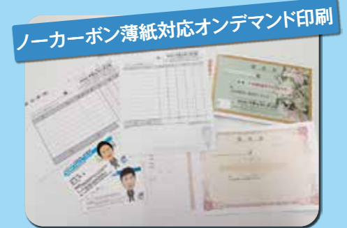
ノーカーボン薄紙対応オンデマンド印刷

納品書、請求書、給与明細書など、経験と知識を元に用途に合った連続伝票をお作りいたします。ナンバリング印刷や裏カーボン印刷にも対応可能です。