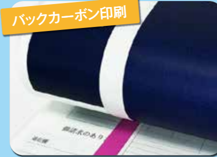
バックカーボン印刷

高い技術と豊富な経験と知識によって、印刷時に溶解・冷却の温度や印圧などを注意深く調整。平滑で転写・発色ムラのない、カーボン面を仕上げます。